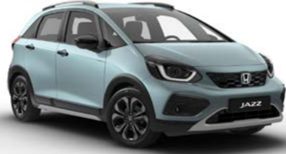
Crosstar Fiyort Mavi Sedefli