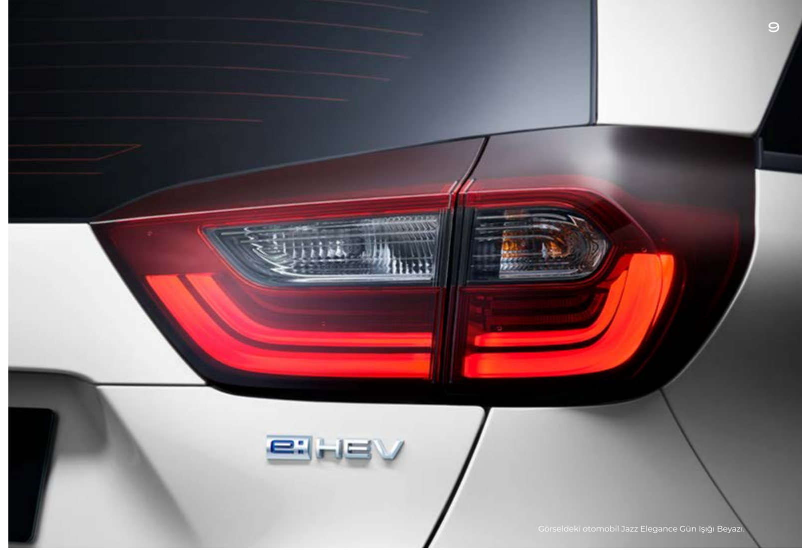
Görseldeki otomobil Jazz Elegance Gün Işığı Beyazı.