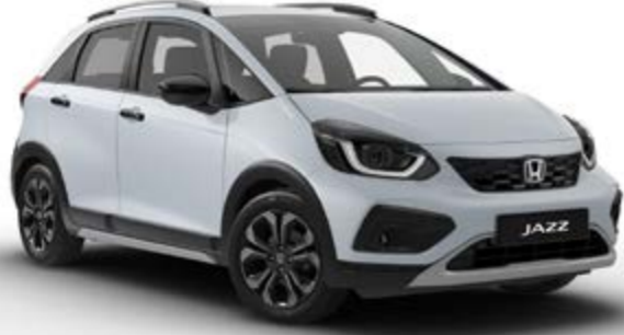
Crosstar Gün Işığ Beyaz Sedefli