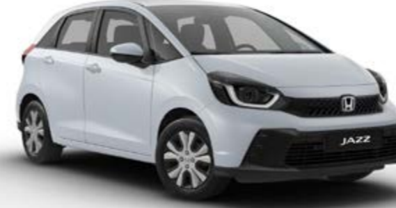
Elegance Gün Işığ Beyaz Sedefli