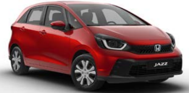
Elegance Kristal Kırmızı Metalik