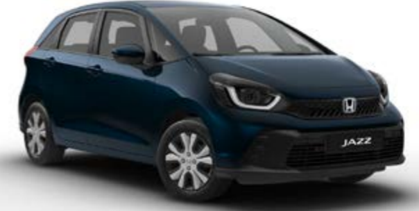
Elegance Gece Yarısı Mavisi Metalik