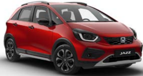
Crosstar Kristal Kırmızı Metalik